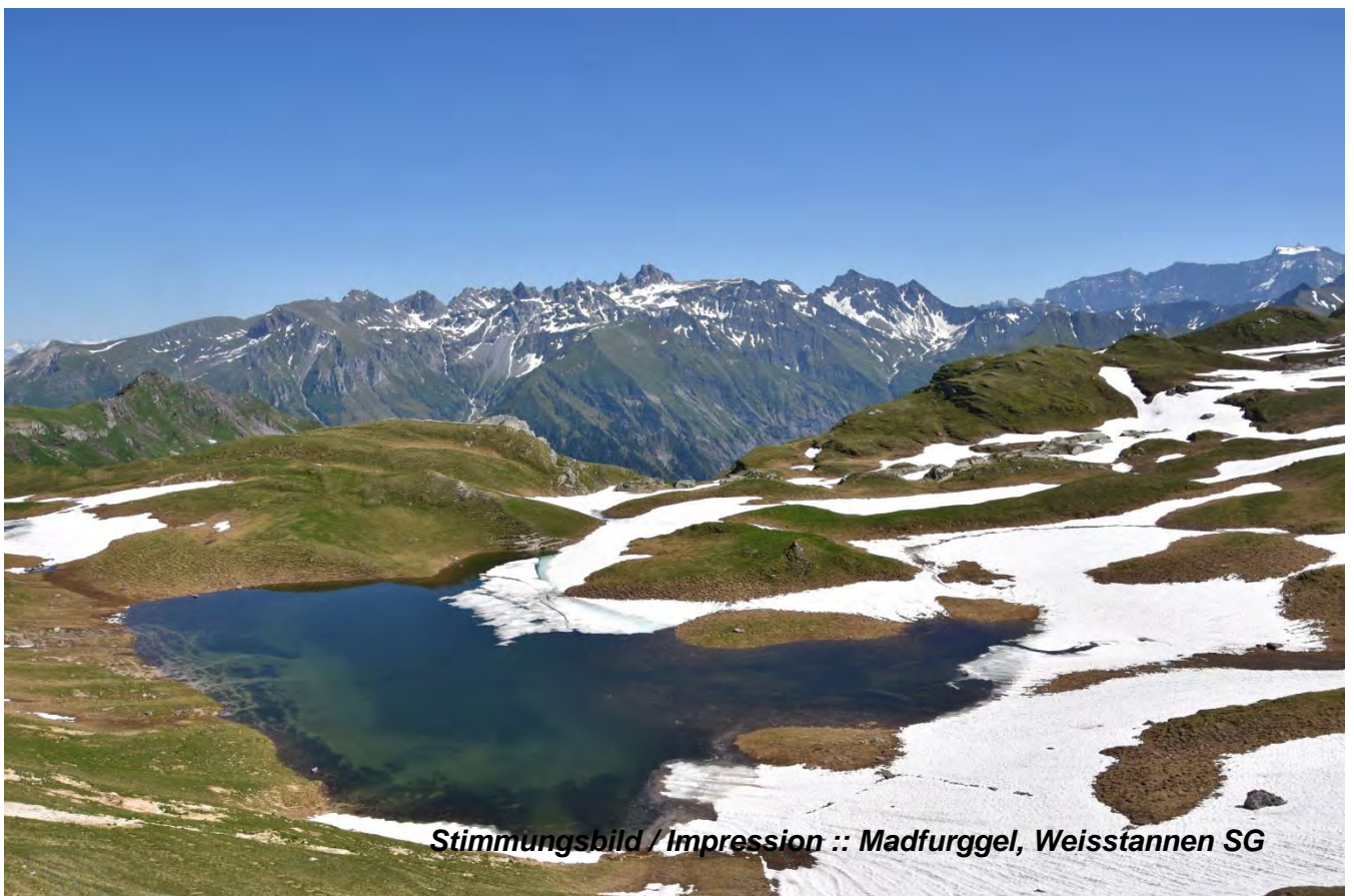
Stimmungsbild / Impression :: Madfurggel, Weissstannen SG