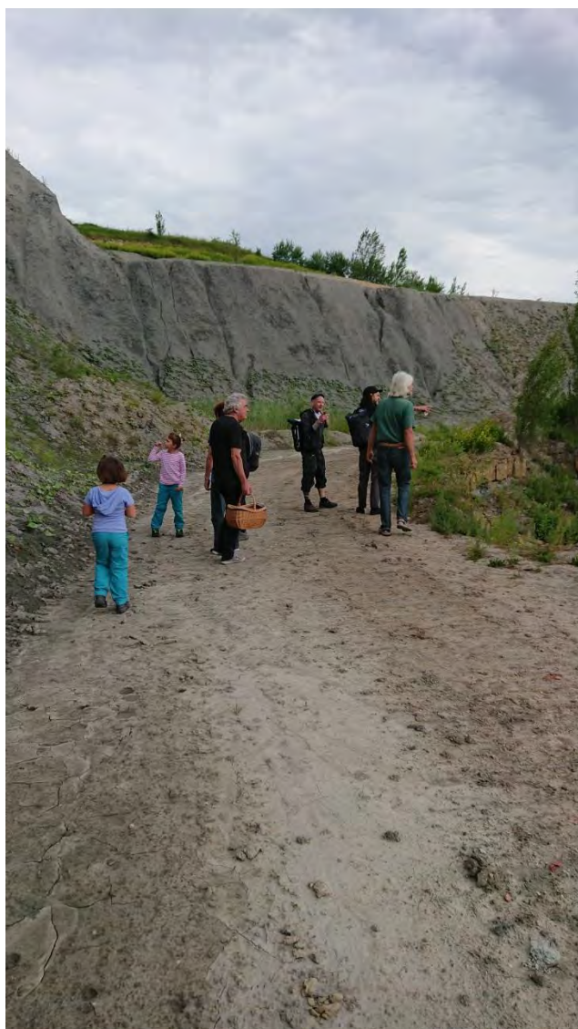
Des Impressions de la sortie en famille au musée des dinosaures à Frick