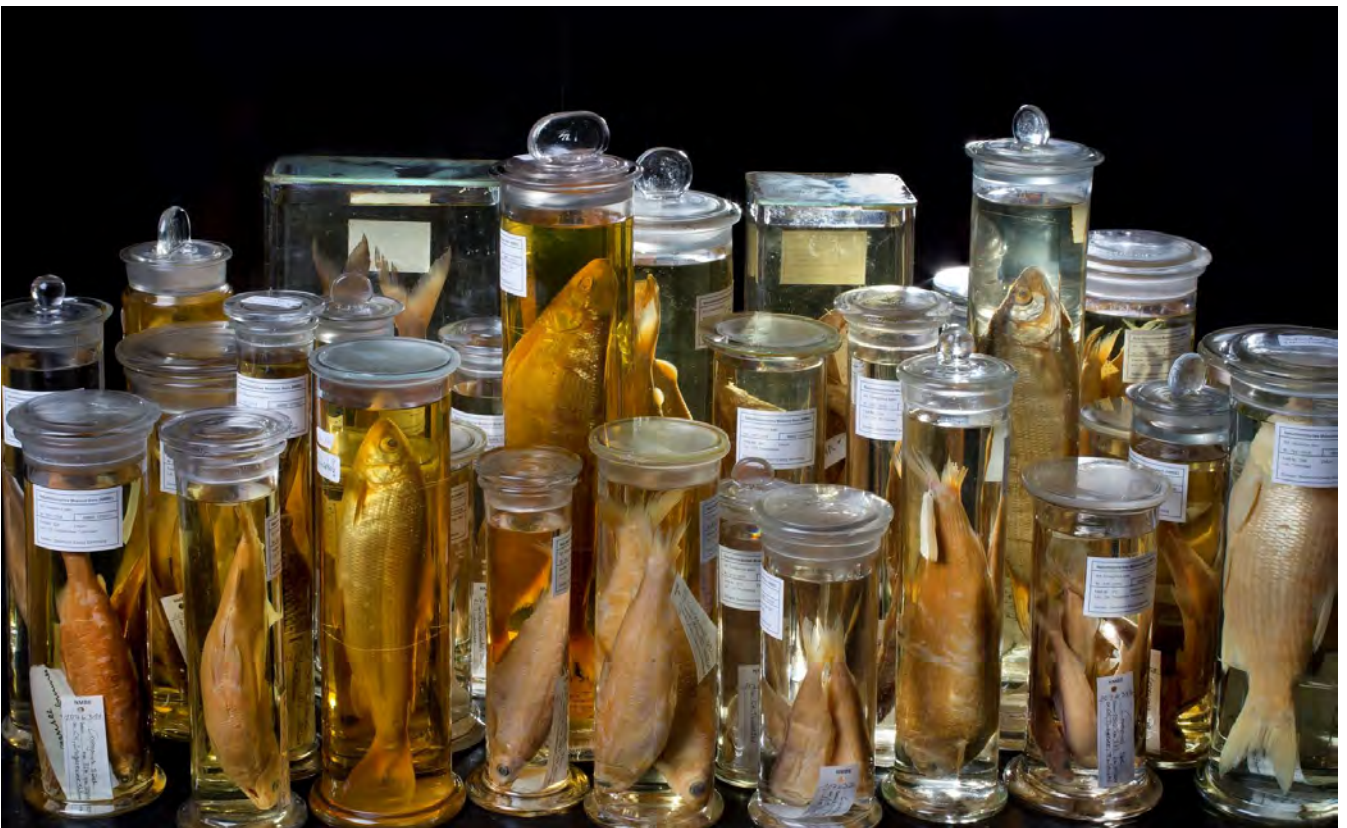
VNPS-Beitrag zum Denkmaltag 2019: historische Nasspräparatesammlung