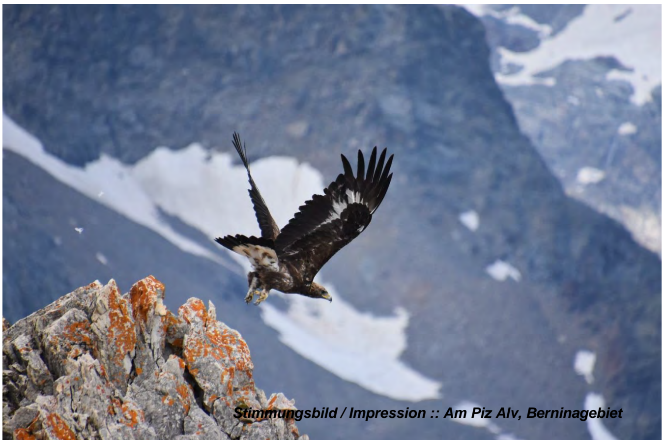
Stimmungsbild / Impression :: Am Piz Alv, Berninagebiet